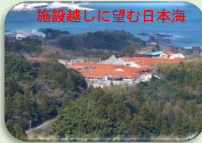
施設越しに望む日本海