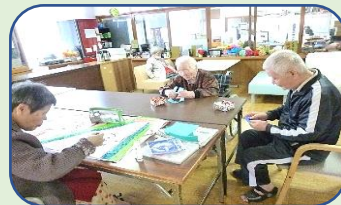
クリスマスツリーづくり